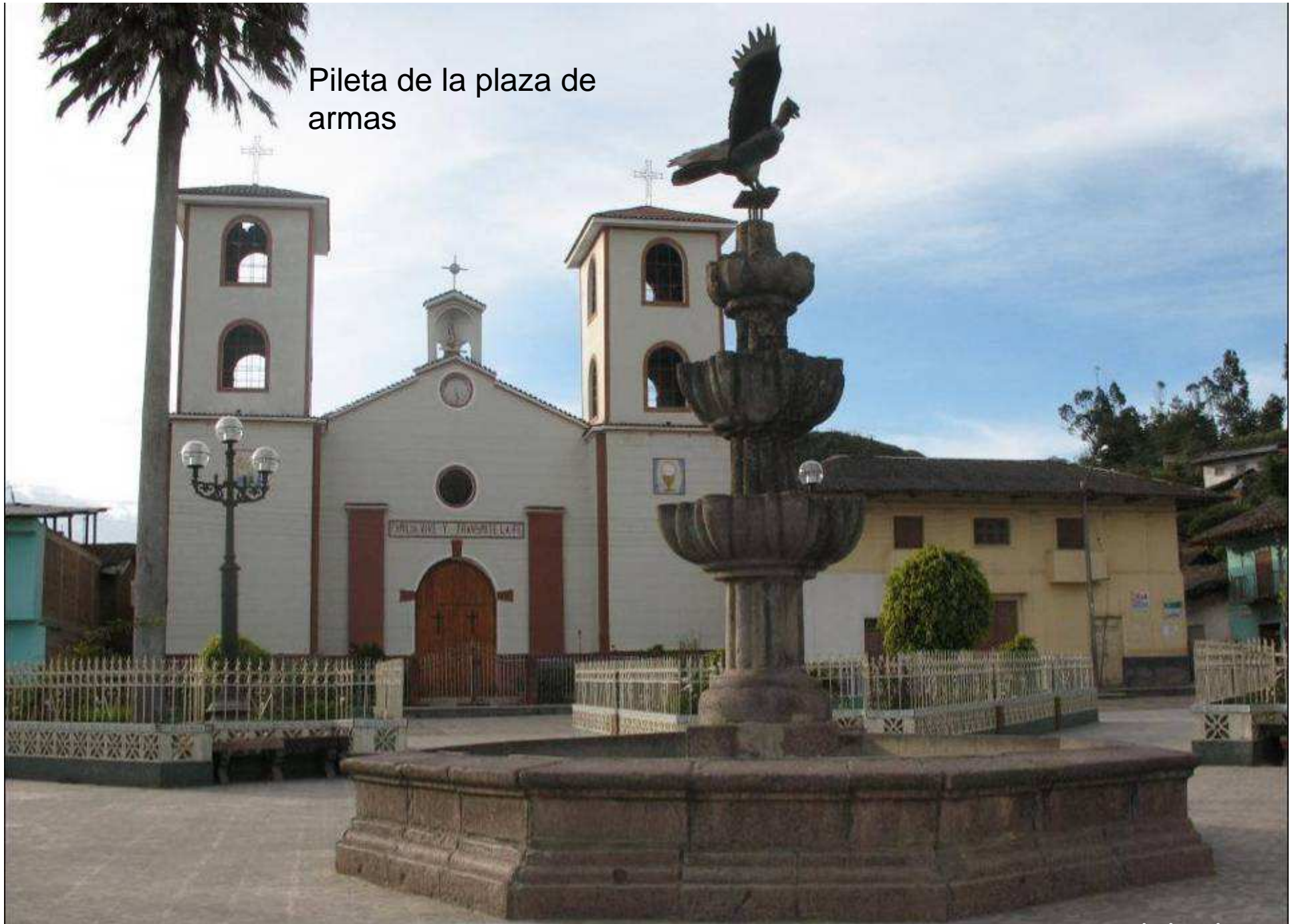
Pileta de la plaza de armas